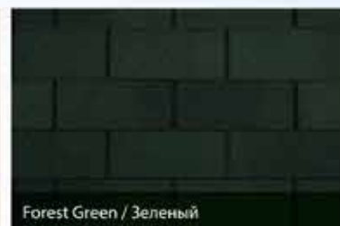
Forest Green / Зеленый