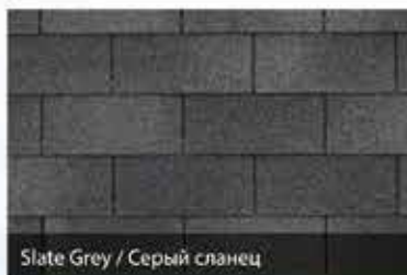
Slate Grey / Серый сланец