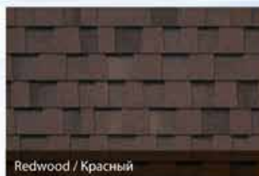
Redwood / Красный