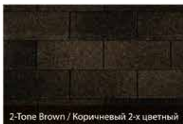
2-Tone Brown / Коричневый 2-х цветный

Эти высококачественные трехгонтовые кровельные листы VP предлагает для оформления коньков и карнизов.