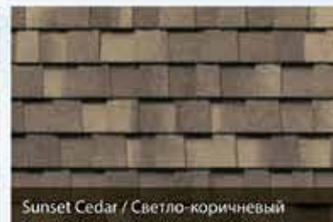
Sunset Cedar / Светло-коричневый