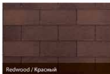
Redwood / Красный