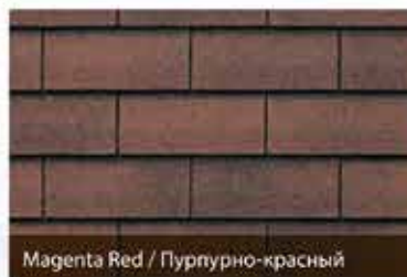
Magenta Red / Пурпурно-красный