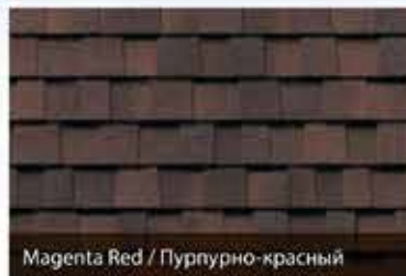
Magenta Red / Пурпурно-красный