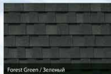
Forest Green / Зеленый