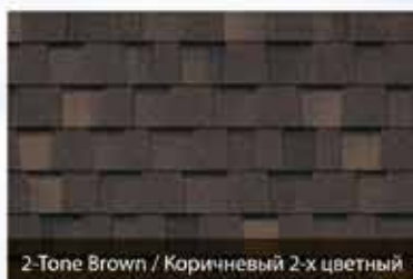
2-Tone Brown / Коричневый 2-х цветный

Как выбрать правильный цвет? Цвет должен гармонировать с архитектурным стилем, цвет также может отражать вашу индивидуальность. Что вы любите больше – сливаться с толпой или выделяться на фоне остальных? К счастью, VP может предложить цветовое решение для каждого стиля.