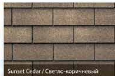
Sunset Cedar / Светло-коричневый