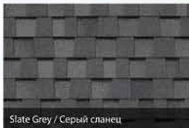
Slate Grey / Серый сланец